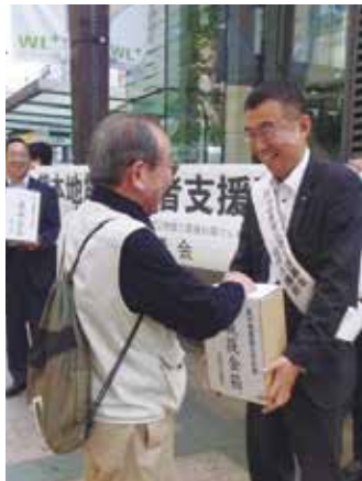
熊本地震での被災者支援の募金を訴える倉元市議 (5月)

準(右参照)で建てられていても、専門家の調査では、8割の住宅が強度が足りないとされています。