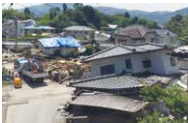
熊本地震での木造家屋の崩壊