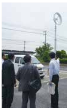
再生可能エネルギーの視察をする倉元市議 (左端、6月)

熊本地震では道路や橋が寸断され、もし原発事故が重なったら避難できないという不安が広がりましたね。