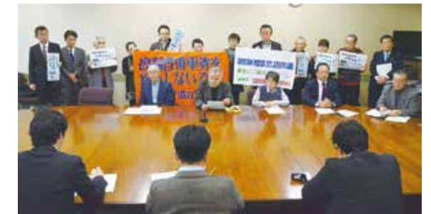
高齢者乗車券の縮小に反対する署名運動の記者会見 (3月)