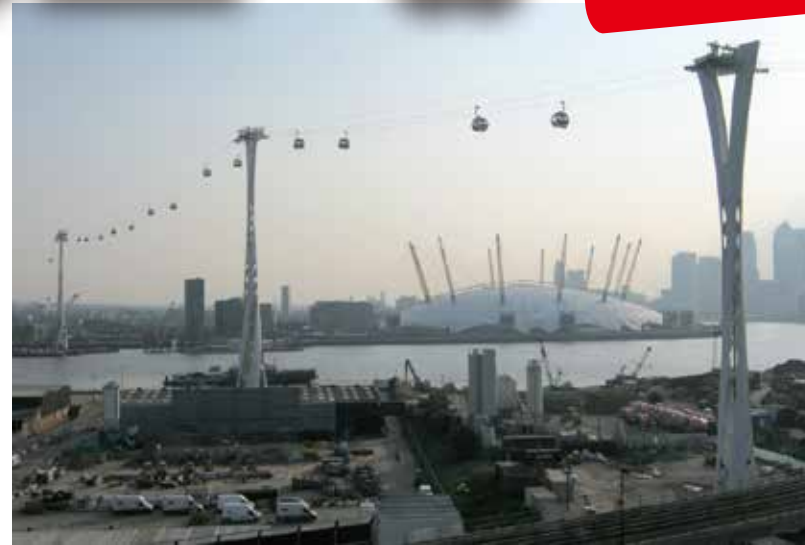
高島市政が参考にしているロンドンのロープウエー