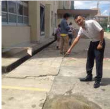
「公共施設を考える会」で学校の危険・老朽箇所を市民とともに毎年チェックし、市教委に改善要望してきました