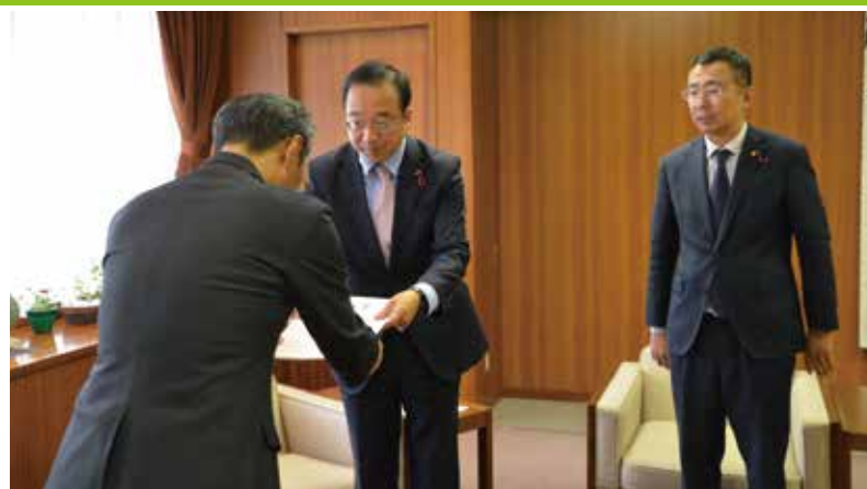
休業補償を申し入れる共産党市議団（4月10日）。

日本共産党福岡市議団は、4月10日に市長に申入れを行い、感染防止のために営業を自粛する中小業者にたいして、自治体として緊急に協力金を支給することや、文化・芸術団体・個人に無観客ライブでの助成などの支援を行うよう申し入れていました。