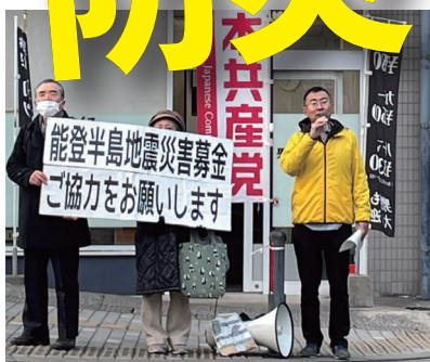
街頭で防災について訴える倉元市議